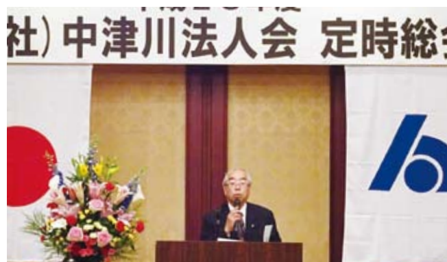
あいさつされる青山会長

と き 平成28年5月20日(金) ところ 恵那峡グランドホテル 出 席 782名(内委任状702名)