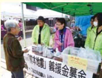
5/1本町通り（中津川市）での募金活動の様子