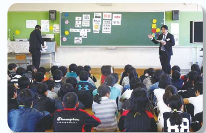
長島小学校の様子