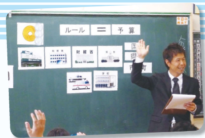
蛭川小学校の様子

青年部会はH24年度から、女性部会はH25年度から小学6年生の「租税教室」の講師を務めており、今年度は8校で講師を務めました。実施に当たっては中津川税務署の全面バックアップをいただいたほか、今回はじめて、中津高校の生徒さんにも税金クイズの出題などご協力いただき、楽しい授業ができました。