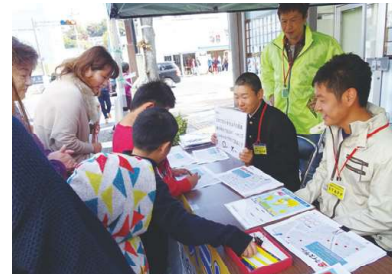
お母さんでも難しいかな？(昨年の様子)