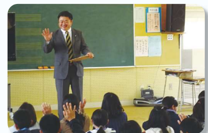
坂下小学校の様子