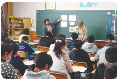
岩邑小学校の様子