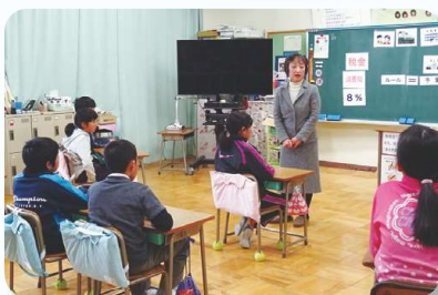
中野方小学校の様子