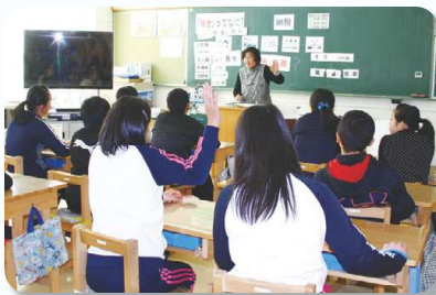
阿木小学校の様子