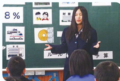
クイズを出題する中津高校生徒さん