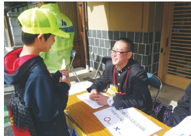
○かな × かな？