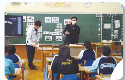
上矢作小学校の様子