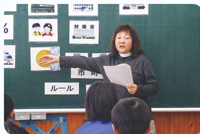
加子母小学校の様子