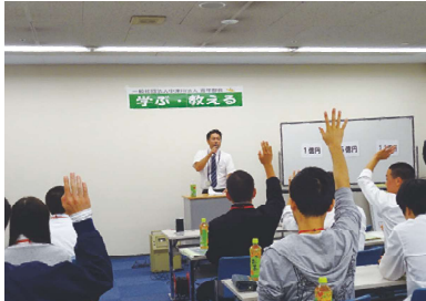
まずは大学生・高校生・青年部会が学びます(昨年の様子)