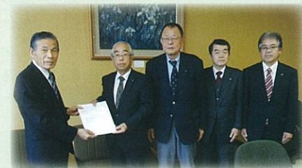
12月10日 可知恵那市長へ 手渡し