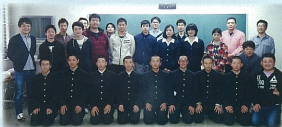
青年部会・大学生・高校生との世代を超えた交流も出来ました

「租税教室」の講義を受けて学んだことをクイズにします。「税」について知ってもらうにはどんなクイズがよいかな..?