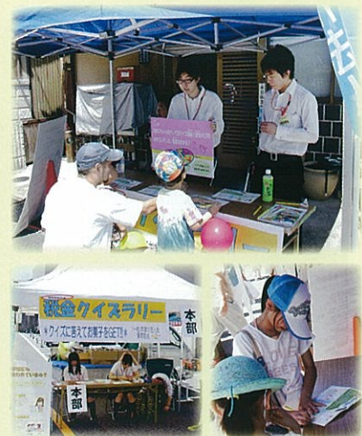
「税金クイズラリー」 昨年の様子