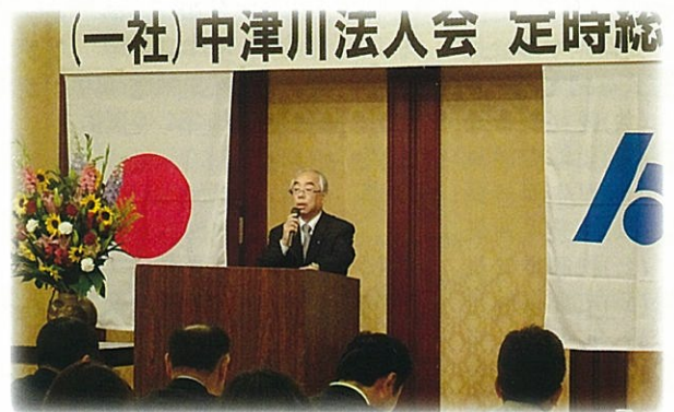
定時総会開会後の冒頭であいさつされる青山会長