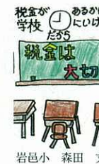
岩邑小 森田 丈 税金が学校に大切