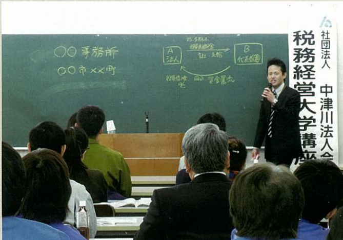
税務講座全3日間の講義をして下さった中津川税務署石川上席官