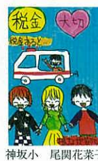
神坂小 尾関花菜子 税金は大切な