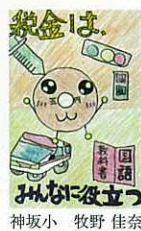
神坂小 牧野 佳奈 税金はみんなにとって 大切なもの