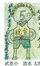
武並小 清水 太翔 税金マン 参上