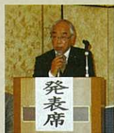
発表に先立ち 挨拶する青山会長