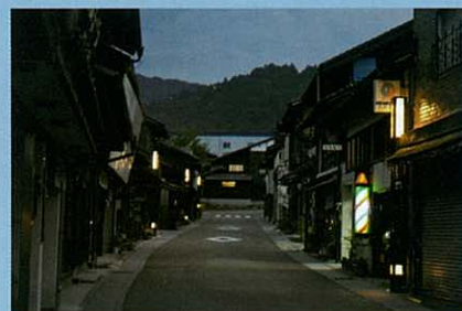
文責 歴史読本編集責任者 西尾精二

これで長年にわたる「無縁仏の祟り」とする因縁が払拭され、これからは「幸せを呼ぶ岩村最古の石造物群」として観光客にもPRを行い「日の目を見た」石仏となりました。又、昨年3月に町並みの電柱がすべて地中化され、街路灯が新調された西町一丁目の夕暮れの情景を紹介いたします。突き当りの左側奥に石造物があり、正面の山が日本百名城の岩村城跡です。