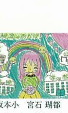
坂本小 宮石 瑚都 税金のおかげで