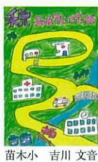
苗木小 吉川 文音 税金は平和を守る