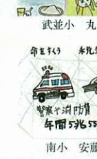
南小 安藤 宗範 税金のおかげで