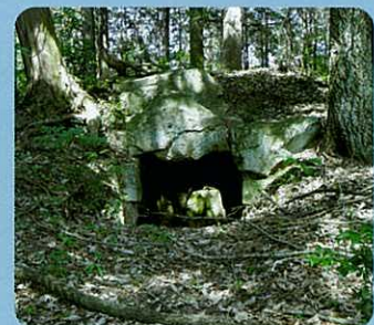
千田17号墳(恵那地方の最大古墳) 恵那市長島町久須見千田川沿い

けで136基の古墳が確認されており、恵那郡下の半分以上を占めていた。)もう一つは、恵那地方南部の阿木、岩村、山岡地域である。そして、奈良時代入ると、前者には正家廃寺、後者には手向廃寺がそれぞれ建立されていた。古墳時代から奈良時代にかけてこの二つの政治圏が存在していたといってもほぼ間違いはない。そして、恵那郡支配の拠点とした郡家(律令制のもとでは地方豪族である郡司が郡の行政を担当してその役所を郡家と呼んだ。)はどこにあったのかと言うと大なる古墳が数多く存在する長島町中野地内の能万寺丘陵地より久須見千田にかけた辺りに位置していたのではないかと考えられている。