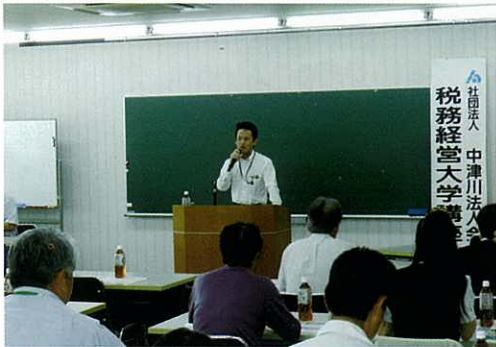
↑ 今回税務講座を担当して下さる 中津川税務署 石川上席官

5日間で延べ74名の申込をいただきました。1日目の出席は51名。10月から始まる改正消費税の経過措置など、実践的な話が満載で、2時間余りの講座があったという間でした。