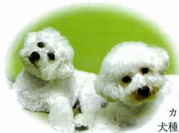
愛犬クー5歳(左)と カイ3歳(右) 犬種：ビション・フリーゼ