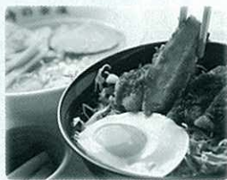
人気メニューが合体! 神坂ラーメン とソースカツ丼がセットになった 『とくとく神坂セット』お値打ちです!