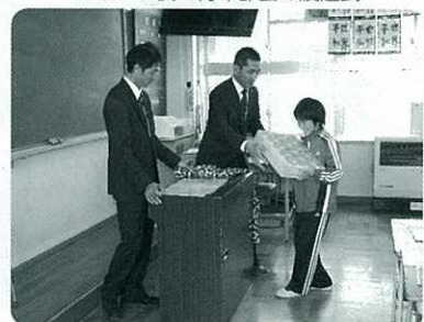
一億円は思った以上に重い！？