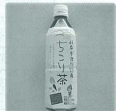
ノンカフェイン、ノンカロリーの 『ちこり茶ペットボトル』 妊婦さんお子様にも安心です。