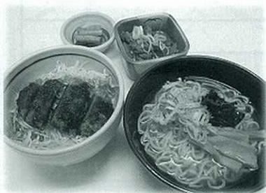
なんと3つの人気 メニューが合体!! 神坂ラーメン&ソ ースカツ丼&もつ 煮のトリプルセット 『ぶち名物セット』 お得ですよ♪