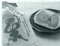
中津川桃山公園にある『夫婦岩』 にちなみ作られた栗饅頭。 『めおと栗』売り切れ御免!