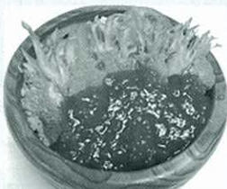
中津川名物料理 『若どりトマト丼』 (ミニラーメン付き)

店内では地域の名産品をはじめとしたお土産、地元の食材をふんだんに使用したお食事をご用意して、皆様のお越しをお待ちしております。(営業時間8:00~20:00)