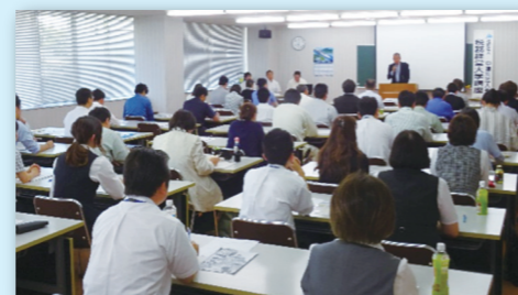
6月14日（第1日目）の講座の様子