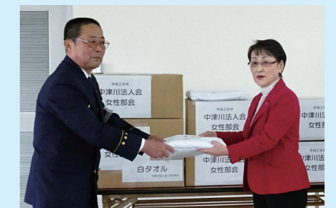
昨年11月 中津川消防署への贈呈の様子

<お問合せ>中津川法人会事務局 TEL 0573(65)6593 / FAX 0573(66)8961