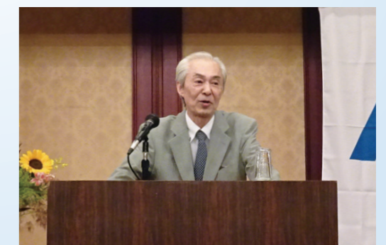
Think Globally, Act Locally! (地球レベルで考え、地域に根ざした行動を！)

を追求し、高付加価値化を図ることです。そしてリーダーは使命感、先見性、決断力をしっかり磨いて下さい。