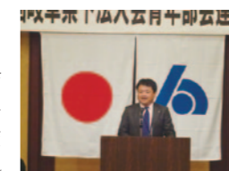
挨拶される末松青年部会長

県内7単位会の青年部会員の他、名古屋国税局・県内税務署の方々にもお集まりいただき盛大に開催いたしました。