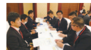
グループ討議される青年部会の皆さん

メインテーマに『青年部会活動のさらなる充実と部会員増強』を掲げ、「小学校での租税教室について」「別の手法の租税教育活動の効果と実施方法などについてのレクチャー」「部会員拡大について」のサブテーマでグループ討議をし、その後討議内容を発表して来場者全員で共有しました。大変有意義な協議会を開催することができました。