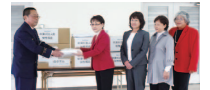
大地中津川消防長(左) 今井女性部会長(左から2人目)