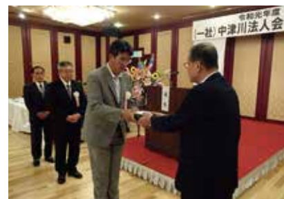
丸山会長より表彰状を授与

全法連功労者表彰と県連会長表彰者が披露された後、中津川法人会 会長表彰の表彰式が執り行なわれました。