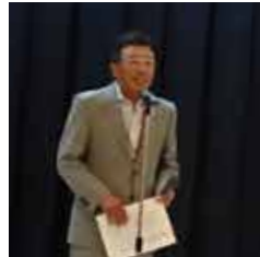
巧みな話術で会場を盛り上げてくれた桂川組織筆頭副部長